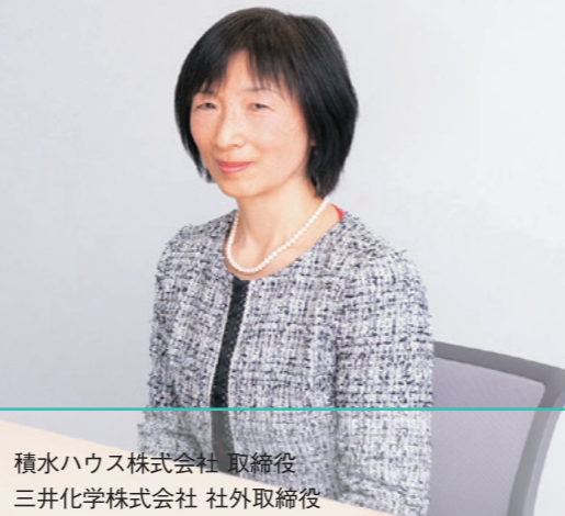
積水ハウス株式会社 取締役 三井化学株式会社 社外取締役 ダイワボウホールディングス株式会社 社外取締役 J-Win 理事

1979年旭硝子株式会社（現AGC株式会社）に入社。2013年同社代表取締役兼専務執行役員、経営全般補佐 技術本部長 グループ改善活動補佐、2014年同社専務執行役員、ガラスカンパニープレジデント、2017年同社エグゼクティブフェロー、2018年より現職。